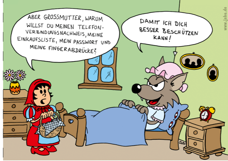
Reines Sicherheitstheater (Illustration: Jascha Buder)